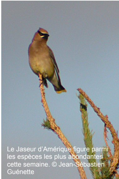
Le Jaseur d'Amérique figure parmi les espèces les plus abondantes cette semaine.

Suivi des Mouettes de Bonaparte : Les Mouettes de Bonaparte commencent à s'accumuler en groupes assez importants dans la région. Lors du dernier dénombrement, elles étaient 2 262 dans la baie du Moulin-à-Baude et 658 dans la baie des Escoumins. Par contre, les juvéniles se laissent toujours désirer : ils ne représentent pour l'instant qu'environ 3% de la population.