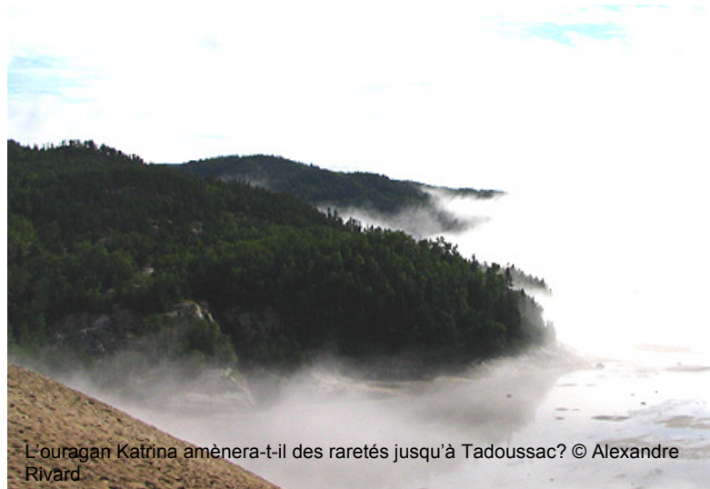
L'ouragan Katrina amènera-t-il des raretés jusqu'à Tadoussac?

d'oiseaux : Dès lundi prochain, l'Observatoire vous propose une nouvelle activité d'interprétation : « La forêt boréale, une pouponnière d'oiseaux ». C'est l'occasion d'en savoir plus sur les habitats fauniques de la forêt boréale, sur son importance pour les oiseaux, ainsi que sur les travaux réalisés par l'OOT dans le cadre de la surveillance de cet écosystème peu accessible. Les participants pourront de plus assister aux opérations de démaillage des oiseaux capturés dans les filets et de baguage. L'activité a lieu du mercredi au dimanche, à 7h00 et dure environ 1h30. Pour participer, vous devez réserver votre place (maximum de 15 participants par activité) en contactant les naturalistes du parc national du Saguenay à la Maison des Dunes, au (418) 235-4238. Des frais de 10$ sont exigés (accès au parc inclus).