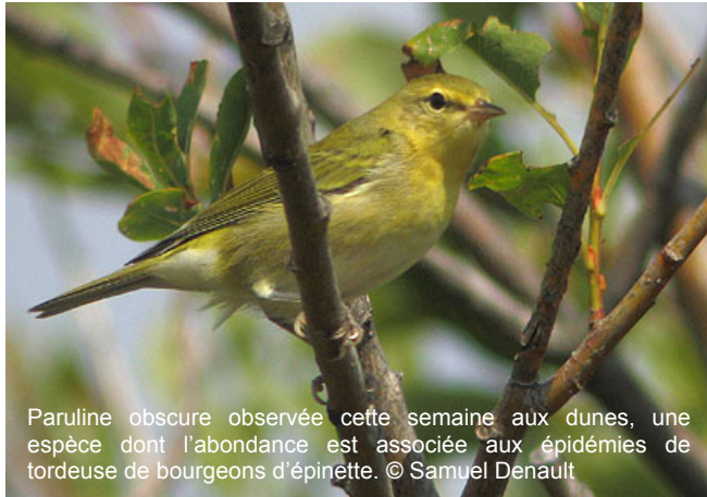
Paruline obscure observée cette semaine aux dunes, une espèce dont l'abondance est associée aux épidémies de tordeuse de bourgeons d'épinette.

l'automne. En tout durant cette seule journée, 116 oiseaux de proie ont été recensés, ce qui représente plus de la moitié des rapaces observés cette semaine. Les Petites Buses, quant à elles, se font toujours attendre. Un coup d'œil sur HawkCount ( http://hawkcount.org ) indique des résultats similaires chez les autres observatoires nord-américains, plus au sud. Étant donné que cette espèce migre habituellement tôt en saison et qu'elle ne semble pas être en aval de Tadoussac, nous nous attendons donc à un premier passage significatif dans le courant de la prochaine semaine.