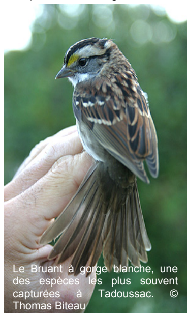
Le Bruant à gorge blanche, une des espèces les plus souvent capturées à Tadoussac.

du lac Supérieur) enregistre des captures records de parulines (principalement en août) ce qui n'est toutefois pas le cas au Long Point Bird Observatory (lac Érié). Au passage, mentionnons la capture de notre première Paruline à couronne rousse de la saison. Du côté des nyctales, nous en sommes déjà à un total de 8 captures pour la saison, dont une recapture. Il s'agissait d'une femelle de Petite Nyctale, âgée de deux ans, qui avait été baguée le 9 novembre 2004, en