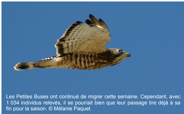
Les Petites Buses ont continué de migrer cette semaine. Cependant, avec 1 034 individus relevés, il se pourrait bien que leur passage tire déjà à sa fin pour la saison.

Vous rappelez-vous de la photo du pygargue bagué, parue dans la chronique de la semaine dernière ? Nous avons appris que cet oiseau a été bagué le 25 mai 2004, à Cobbosseecontee Lake, dans le Maine (430 kilomètres de Tadoussac). D'après Charlie Todd, biologiste au Maine Department of Inland Fisheries and Wildlife , il s'agirait du premier pygargue bagué au Maine à être rapporté au Québec depuis le début de leur programme (près de 800 individus bagués depuis 1975).