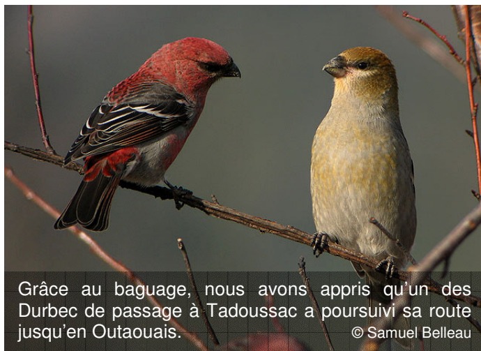
Grâce au baguage, nous avons appris qu'un des Durbec de passage à Tadoussac a poursuivi sa route jusqu'en Outaouais.

En terminant, toute l'équipe vous souhaite un bel hiver et vous convie à être des siens pour la saison 2008.